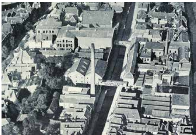
9. Het Tieleman & Dros-complex in 1925. Links is een stukje van de Hooigracht zichtbaar, in het midden de Middelstegracht en rechts de Uiterstegracht. 41