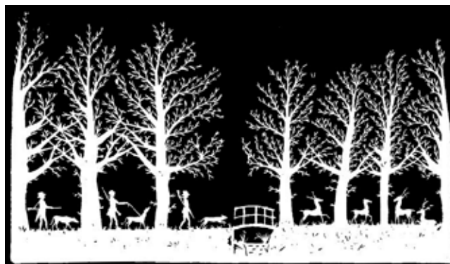
6. Figuurknipkunst van Willem Eigeman