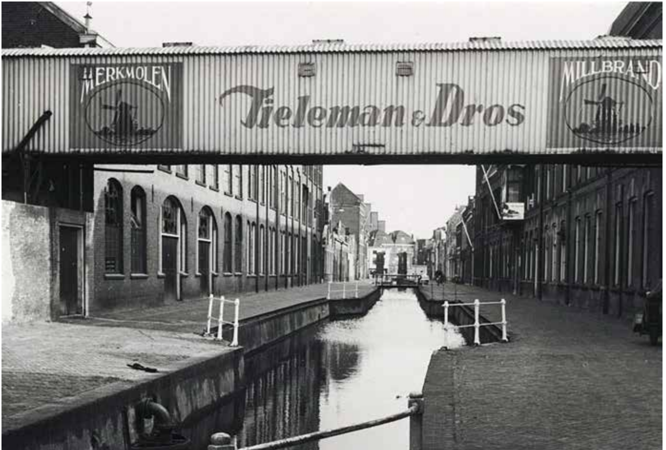
1. De fabrieksgebouwen van Tieleman & Dros stonden aan weerszijden van de Middelstegracht in de Leidse binnenstad. Ze waren verbonden door een loopbrug. De foto is gemaakt in 1956, een jaar na het faillissement van de fabriek. 2