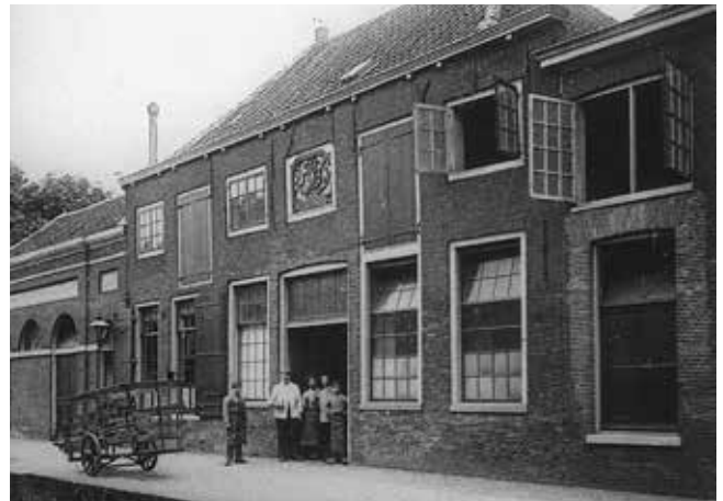
8. De zeepziederij De Gekroonde Haan aan de Middelstegracht 37