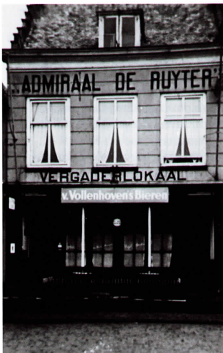
Café Admiraal De Ruyter in Vlissingen